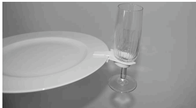
Schéma 2 Pièce en Situation

Le support s'adapte à tout types de verres